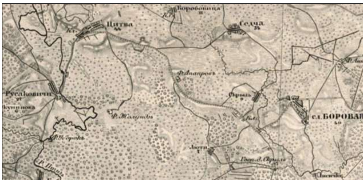
Рисунок 3 Фрагмент Военно-топографической карты Минской губернии 1860-ых гг.