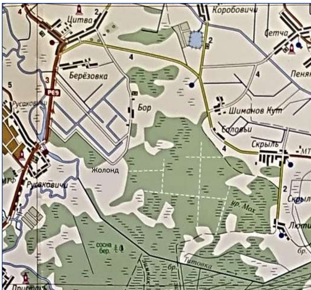
Рисунок 2 Фрагмент современной карты Пуховичского района